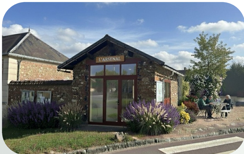
Image d'illustration réalisée à l'aide de l'intelligence artificielle